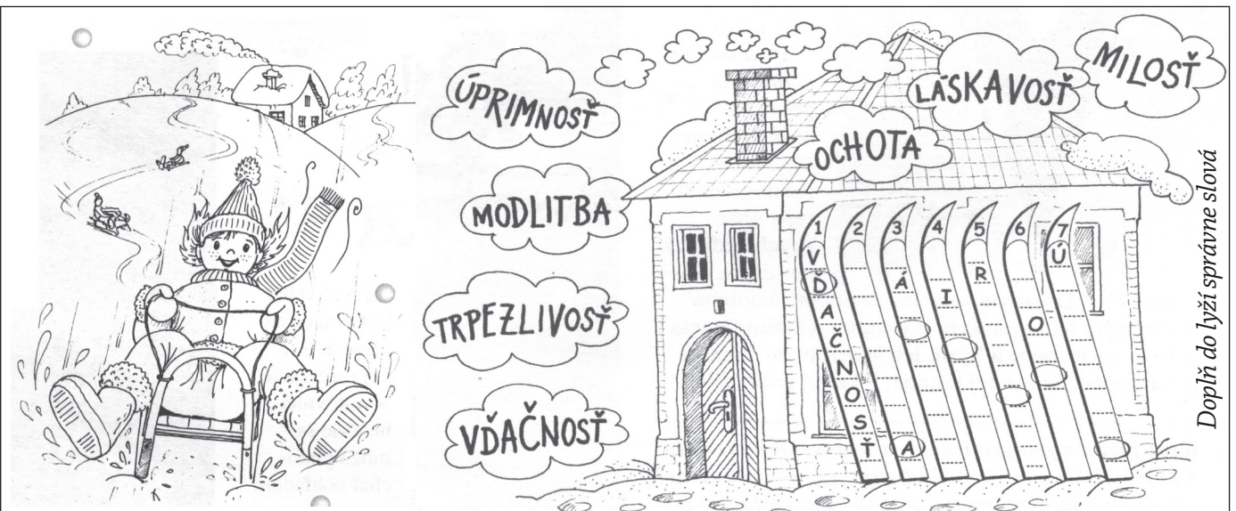
Doplň do lyží správne slová