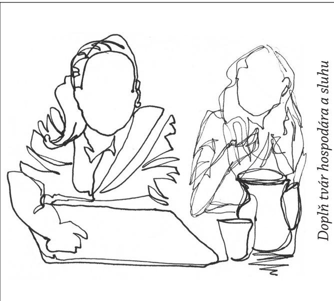
Doplň tvár hospodára a sluhu