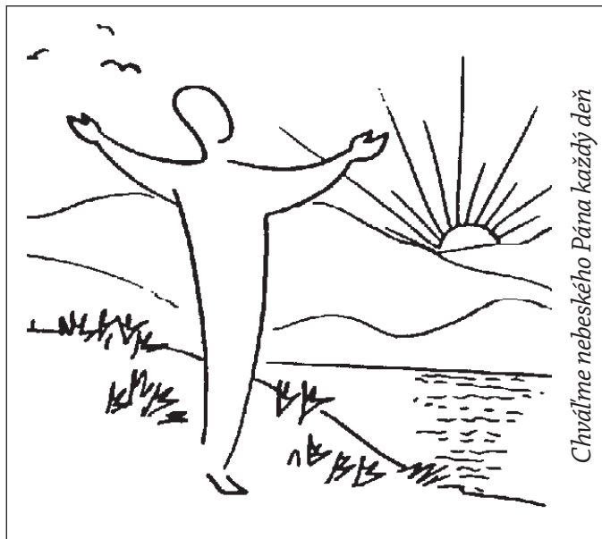
Chváľme nebeského Pána každý deň