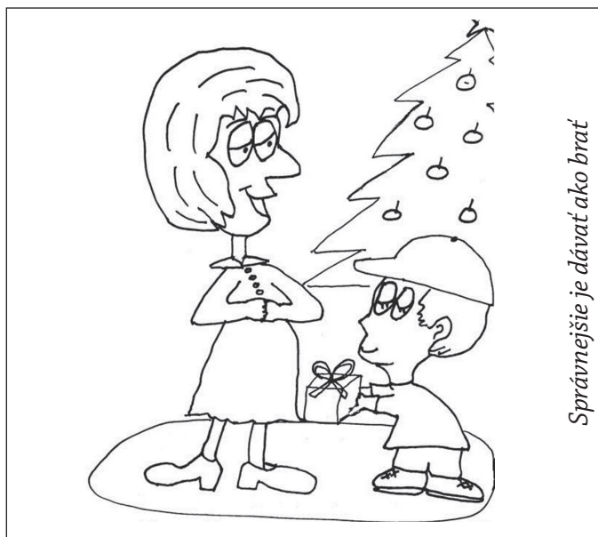
Správnejšie je dávať ako brať