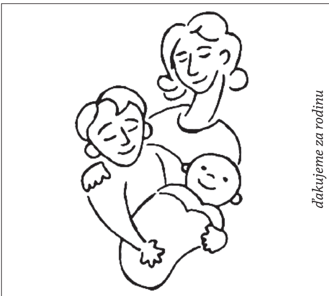
ďakujeme za rodinu