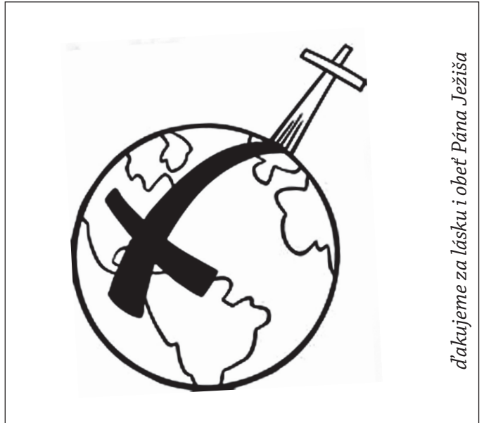
ďakujeme za lásku i obeť Pána Ježiša