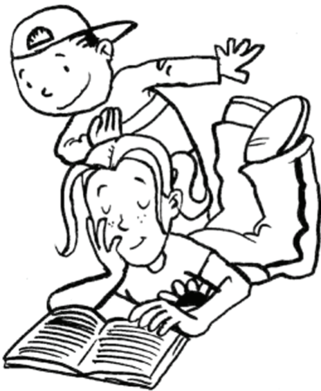
ku prázdninám patril čítanie