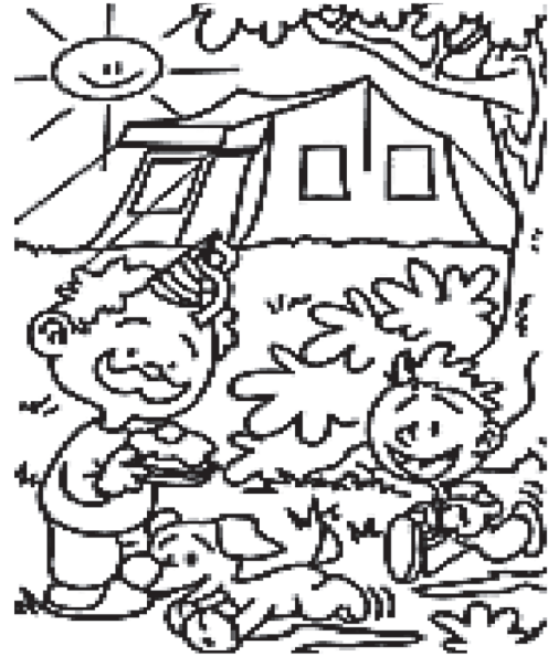
ku prázdninám patril pohyb