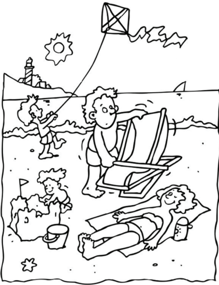
ku prázdninám patril oddych

“ KAŽDÝ DOSTANE SVOJU ODMENU PODĽA VLASTNEJ PRÁCE.” /1K 3, 8/