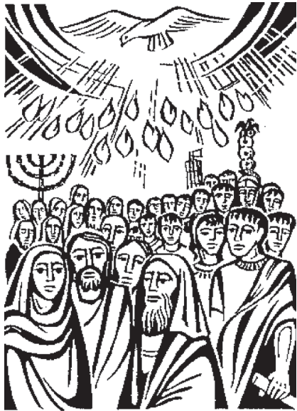
Duch zostúpil na učeníkov v 50. deň po vzkriesení

“VŠETCI, KTORYCH DUCH BOŽÍ VEDIE, SÚ SYNOVIA BOŽÍ” /R 8, 14/