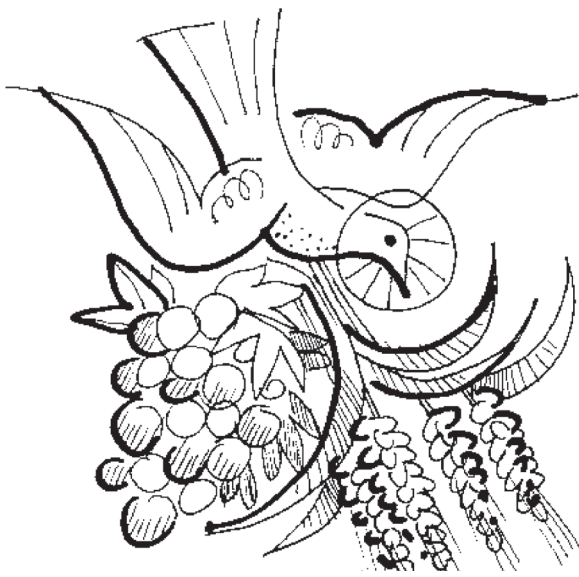
Duch Svätý dáva svoje dary i svoje ovocie