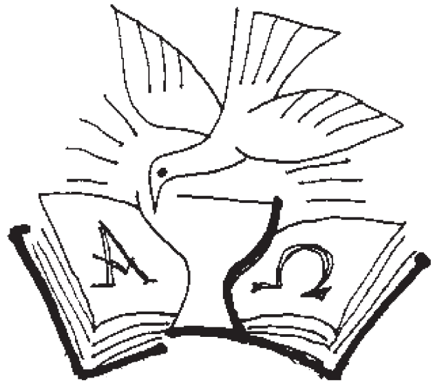
Duch Svätý pôsobí cez Písmo a sviatosti