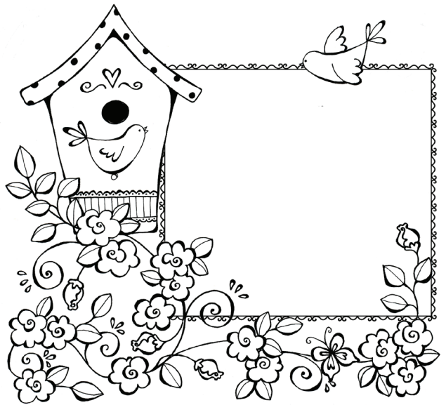
Napíš názov nábožnej piesne, ktorú rád spievaš