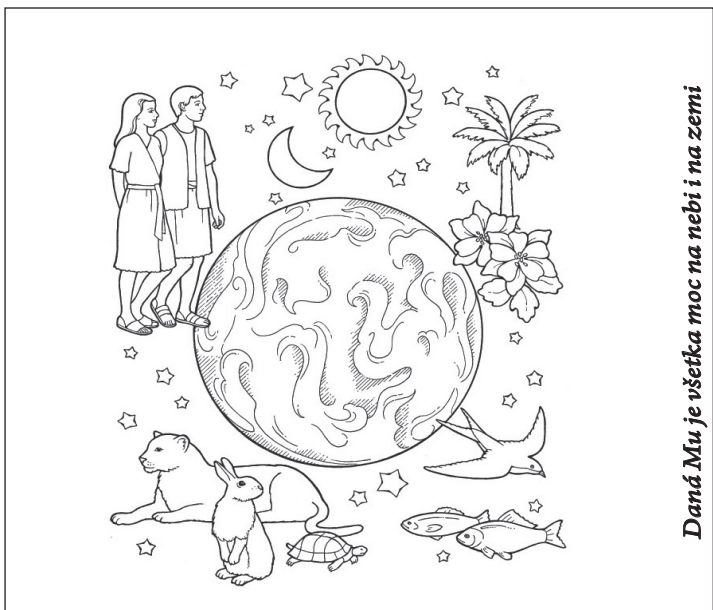
Daná Mu je všetka moc na nebi i na zemi