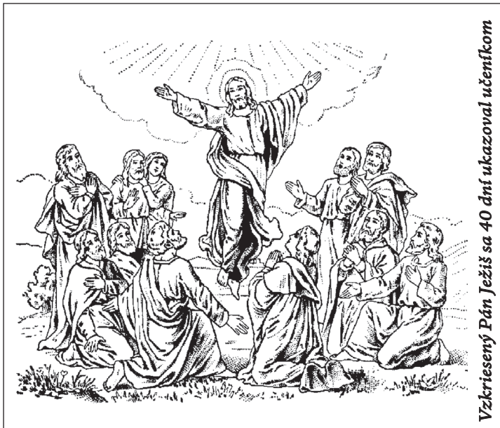
Vzkriesený Pán Ježiš sa 40 dní ukazoval učeníkom

“VÁM PROSPEJE, ABY SOM ODIŠIEL; LEBO AK NEODÍDEM, RADCA NEPRÍDE K VÁM/J 16,7/