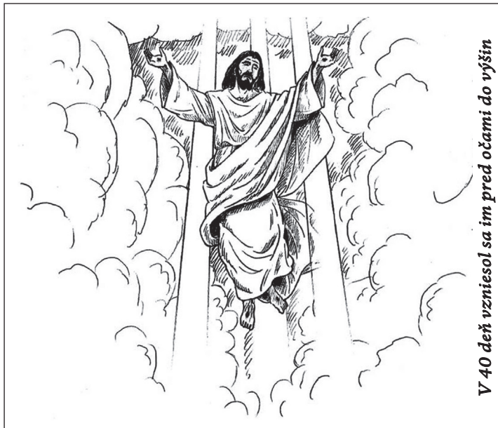
V 40 deň vznesol sa im pred očami do výšin