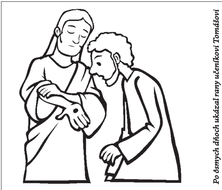
Po ôsmich dňoch ukázal rany učeníkovi Tomášovi