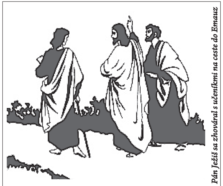
Pán Ježiš sa zhováral s učeníkmi na ceste do Emmauz