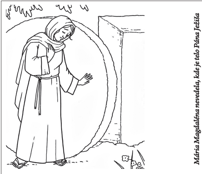
Mária Magdaléna nevedela, kde je telo Pána Ježiša