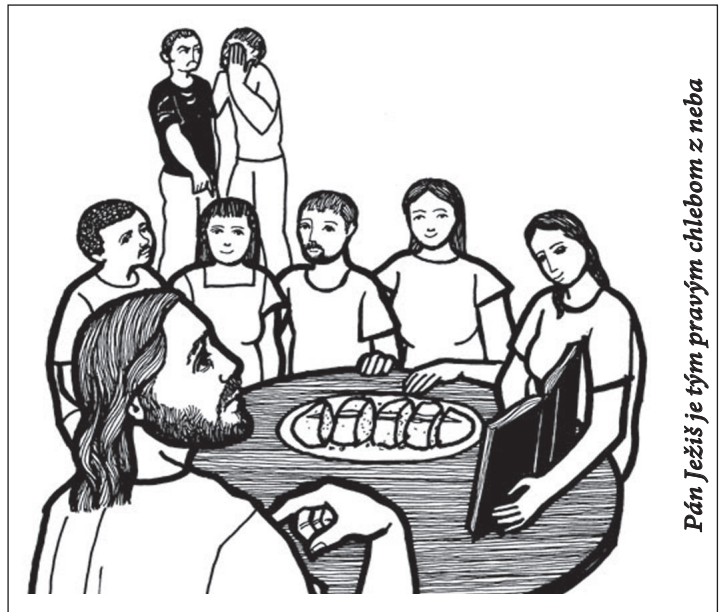
Pán Ježiš je tým pravým chlebom z neba