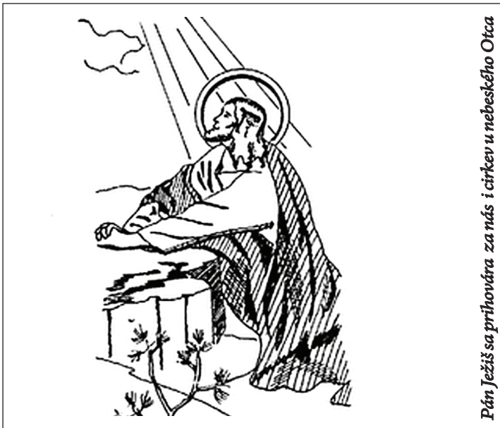
Pán Ježiš sa prihovára za nás i cirkev u nebeského Otca