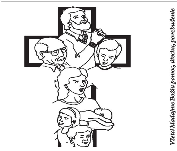
Všetci hľadajme Božiu pomoc, útechu, povzbudenie