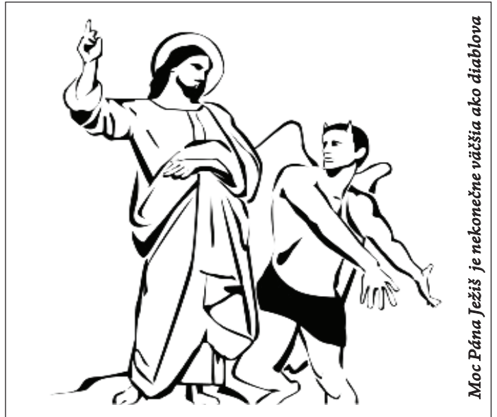
Moc Pána Ježiš je nekonečne väčšia ako diablava