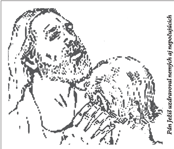
Pán Ježiš uzdravoval nených aj nepočujúcich

“JEŽIŠ NA KRÍŽI ODZBROJIL KNIEŽATSTVÁ A MOCNOSTI.” /KOLOSENSKÝM 2, 15/