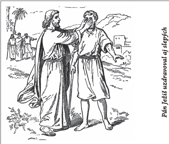
Pán Ježiš uzdravoval aj slepých

“PÁN BOH NÁS ZMIERIL SO SEBOU V KRISTOVI A ZVERIL NÁM SLUŽBU ZMIERENIA!” /2K 5, 18/