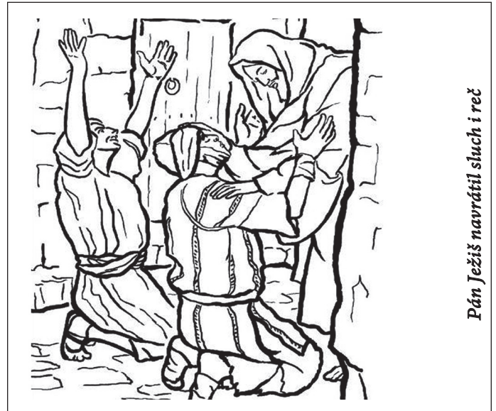
Pán Ježiš navrátil sluch i reč