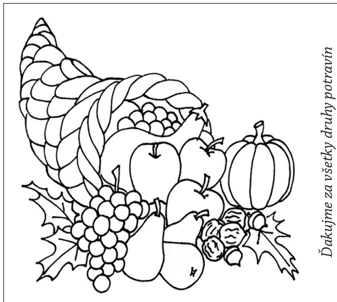
Ďakujeme za všetky druhy potravín