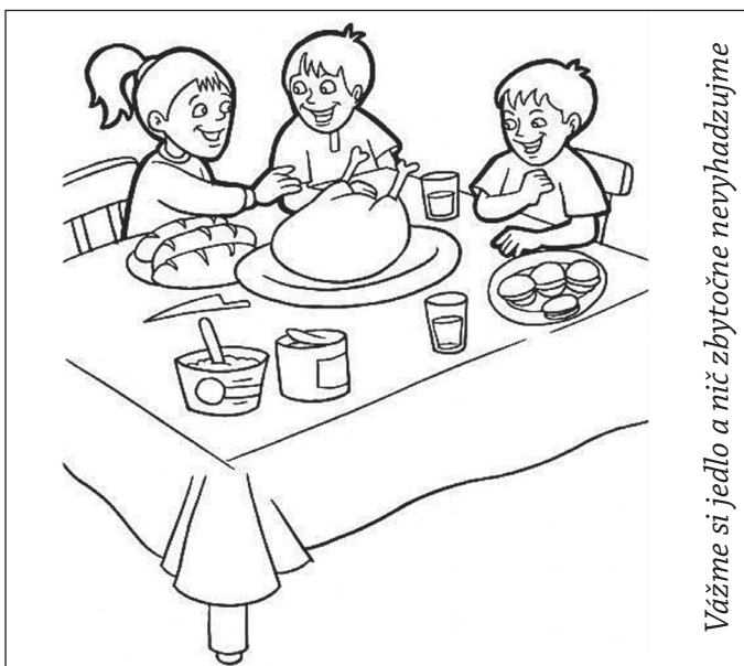
Vážme si jedlo a nič zbytočne nevyhadzujeme